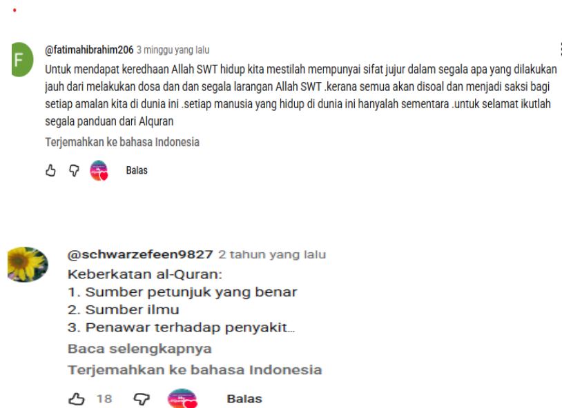
Gambar 2. Interaksi dan Komentar Subscriber pada Kanal My #QuranTime

Hasil penelitian menunjukkan bahwa aktivitas keagamaan yang berlangsung pada kanal My #QuranTime memiliki fungsi sosial yang signifikan dalam membangun solidaritas keagamaan. Interaksi yang terjadi melalui kolom komentar, live chat, dan berbagai bentuk partisipasi digital menciptakan ruang komunikasi yang memungkinkan pengguna saling memberikan dukungan moral, doa, dan motivasi spiritual. Kondisi ini memperlihatkan bahwa media digital mampu menjadi ruang sosial baru bagi terbentuknya komunitas keagamaan yang berlandaskan nilai-nilai Al-Qur'an (Nasaruddin & Muthmainnah, 2026).