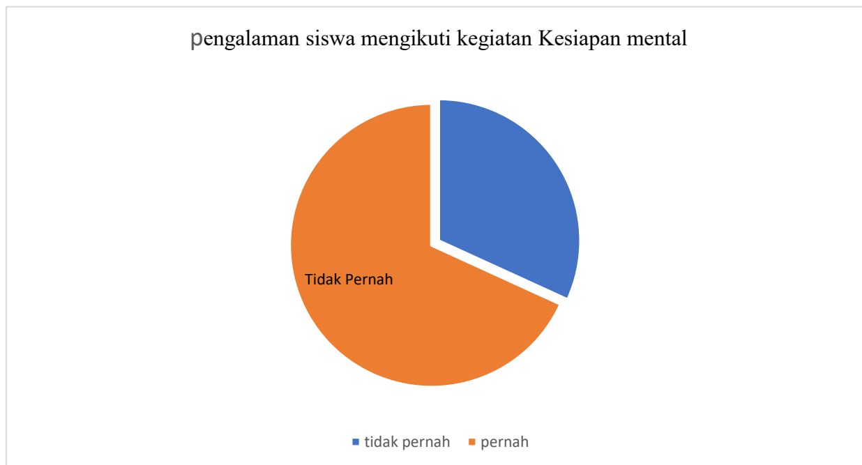
Gambar 2. Pengalaman Siswa Mengikuti Kegiatan Kesiapan Mental

Gambar 2 memperlihatkan bahwa sebagian besar siswa telah pernah mengikuti kegiatan yang berkaitan dengan kesiapan mental, sedangkan sebagian lainnya belum pernah memperoleh pembinaan serupa sebelumnya. Hasil tersebut menunjukkan bahwa program sosialisasi dan pembinaan masih sangat diperlukan untuk memperkuat pemahaman siswa mengenai kesehatan mental dan pengaruh modern culture dalam kehidupan sehari-hari.