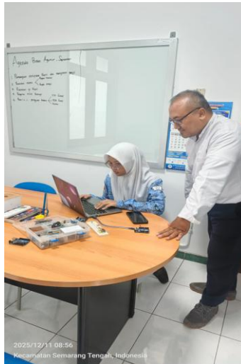
Gambar 3 Latihan Emulator IoT

Pada pelatihan simluasi IoT di SMK 5 Semarang berbasis hands-on dan project based learning, terbukti meningkatkan kompetensi siswa SMK secara signifikan (78% peningkatan pemahaman). Selain itu juga, tersusunnya 5 prototype fungsional yang relevan dengan permasalahan lokal menunjukkan potensi penerapan IoT dalam pembelajaran SMK. Partisipasi peran aktif dari para siswa dan respon positif sangat bagus dengan nilai (4.6/5.0), hal ini mengindikasikan minat yang tinggi terhadap pembelajaran teknologi IoT yang kita paparkan.